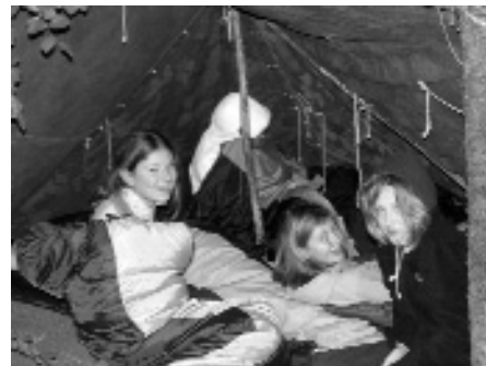
Das Übernachten unter einer Biwakplane im Wald ist allein schon eine Herausforderung für sich.

gekocht. Alles „selfmade“! Am Abend gibt es beim Lagerfeuer immer viel aufzuarbeiten und so mancher Zwist liefert dazu noch dankbares Anschauungsmaterial.