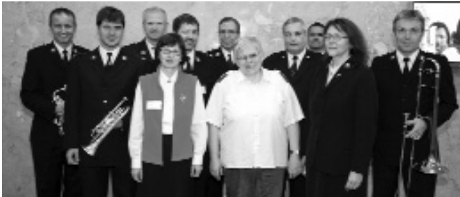
Das tatkräftige Team der Heilsarmee

Redaktionsschluss für die nächste Ausgabe: 15. Jänner 2008