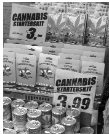
Cannabis Starter Kits - armes Holland