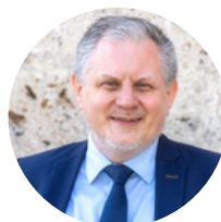
Oliver Stozek Generalsekretär der Evangelischen Allianz Österreich